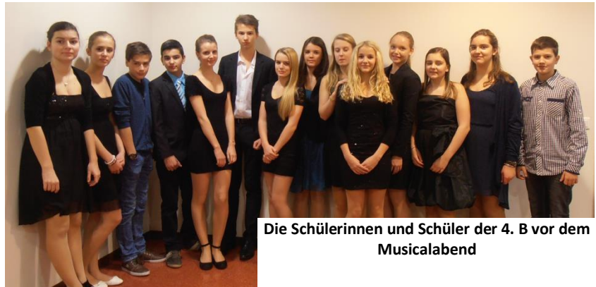
Die Schülerinnen und Schüler der 4. B vor dem Musicalabend

Die Highlights dieser Woche waren auf jeden Fall das Planetarium, das ausgiebige Shoppen und das "Überlebenstraining" in der Mariahilferstraße.